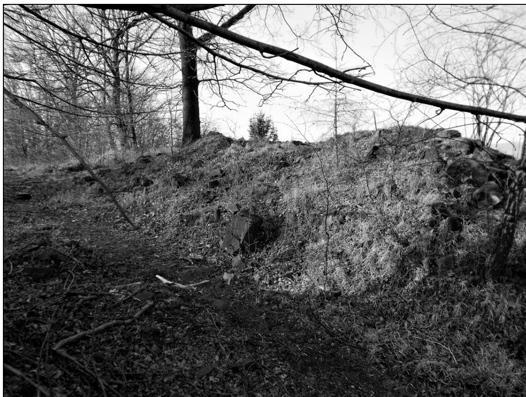
OBR. 2. Čelní val hradiště Radošov I v řezu.

Nezákonný výkop v západní části hradiště odhalil objekt neznámého stáří a účelu. Jde patrně o základy částečně zahloubené do země o rozměrech přibližně 2 x 2m z na sucho kladených kamenů, které nesly nějaký nadzemní objekt. Tento objekt není zatím nijak datován.