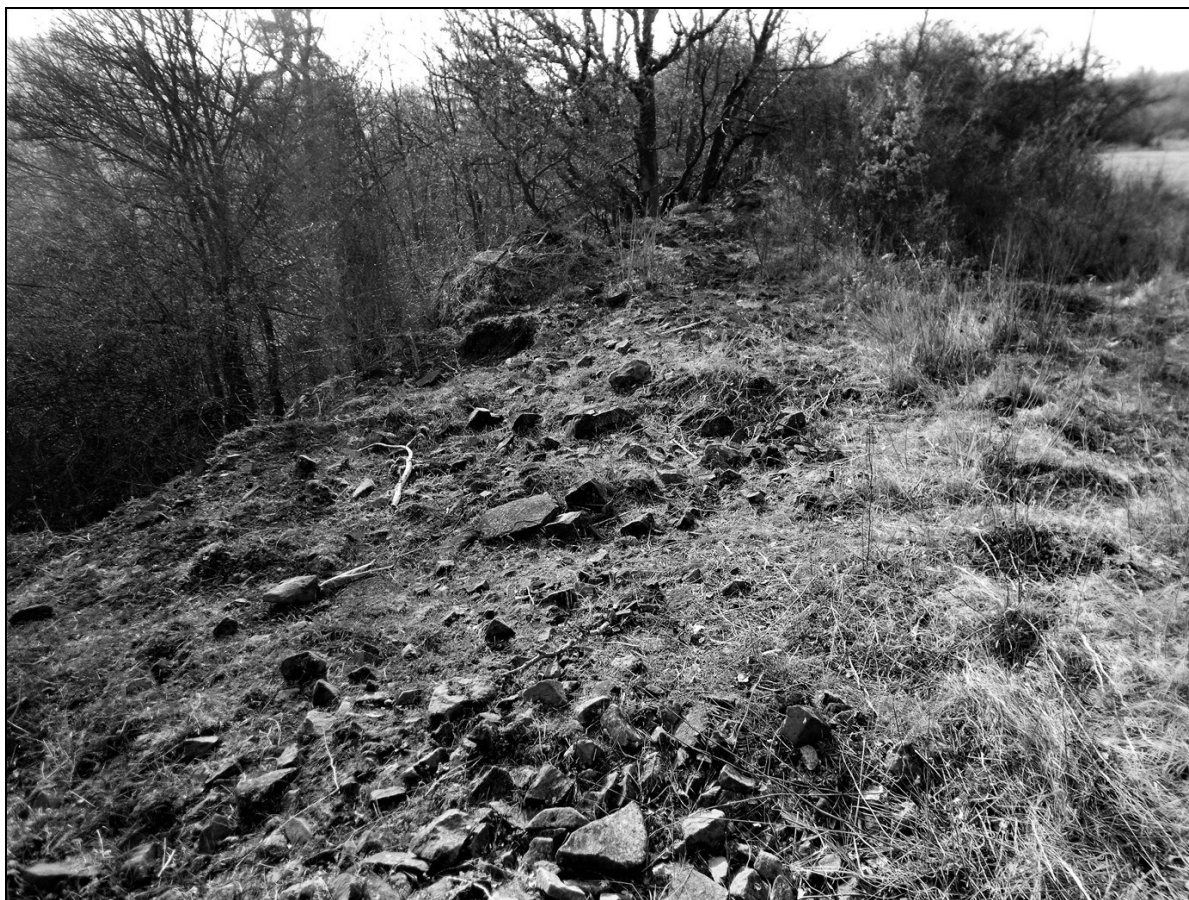
OBR. 3. Obnažený val na lokalitě Radošov II.

Jedná se o hradiště na sousední stolové hoře přecházející východním směrem v úzký hřeben rozšiřující se na východě v malou plošinu, kdysi oddělenou od sousedního vrchu roklí, dnes částečně zasypanou navážkami.